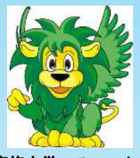
専修大学マスコット「センディー」